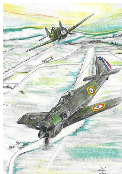
Dessin d'Yves « aérodrome Cravant » (évoquant 1946)